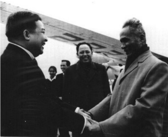
សីហនុ ជាមេខ្មែរក្រហម បំរើនយោបាយអោយពួកកុម្មុយនិស្ត យួន និង ចិន

ចំណែកឯ សា ឡុតសរ ដែលទទួលបានអាហាររូបករណ៍ទៅសិក្សាប្រទេសបារាំងផ្នែកអគ្គិសនីបានចាប់ អារម្មណ៍រឿងនយោបាយ ហើយបានអានសៀវភៅកុម្មុយនិស្ត(សៀវភៅក្រហម)នៅប្រទេសបារាំង។ ដំបូង ឡើយ សា ឡុតសរ បានដឹកនាំធ្វើការតស៊ូប្រឆាំង និងការដឹកនាំរបបសក្តិភូមិរបស់ នរោត្តម សី ហនុ តាំងពី គាត់កំពុងសិក្សានៅប្រទេសបារាំង ក្រោយមកស្តេច នរោត្តម សីហនុ បានកាត់ផ្តាច់អាហាររូបករណ៍វិញ ដោយគាត់ មិនទាន់រៀនចប់ផង ក៏ត្រឡប់មកប្រទេសខ្មែរវិញ។ ក្រោយពេលដែលគាត់មកដល់ប្រទេសខ្មែរ ដោយការមិន ពេញចិត្តនឹងរបបសក្តិភូមិ ដឹកនាំដោយ សីហនុ គាត់បានរៀបចំធ្វើនយោបាយបដិវត្តន៍នៅក្នុងប្រទេសខ្មែរ ហើយ ផែនការបានបែកដឹងដល់អាជ្ញាធរ សីហនុ ទើប សីហនុ បានប្រកាសដេញចាប់ សា ឡុតសរ និងអ្នកចូលរួម ក្នុងកិច្ចការនេះមួយចំនួនទៀត មានចំនួន ៦៣ នាក់ក្នុងនោះមាន សុន សេន ដែរ។ ពេលនោះ សា ឡុតសរ បានរត់ចូលព្រៃហើយបានចូលទៅធ្វើជាលេខារបស់ ទូ សាមុត ដែលដឹកនាំដោយ ស៊ីង ដុំកមិញ។ យើងឃើញថា យួនបានជួយខ្មែរក្រហមអោយប្រឆាំង និងនរោត្តម សីហនុ