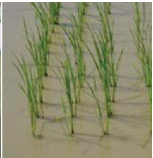
ពូជស្រូវ អ៊ីអិ ៦៦ និងពូជស្រូវសែនពិជោរ