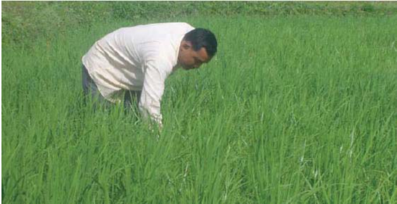
(សន្លូង) មានមមាចត្នោត ដង្កូវបំពង់កាត់ស្លឹក ដង្កូវស៊ីរូងដើម ដង្កូវហ្វូង។ល។ ដំណាក់កាលដាក់ទឹកដោះមានដង្កូវមូរស្លឹក ស្រឹង កណ្តុរ និងសត្វចាបជាដើម។

- ត្រូវចុះពិនិត្យស្រែ និងតាមដានការលូតលាស់របស់ដំណាំស្រូវជារបចាំក្រោយពេលស្ងួតរួច។ ត្រូវធ្វើការជួសសន្លូងនូវគុម្ពណាដែលបាត់ ក្រោយពេលស្ងួតពី ៥ ទៅ ៧ ថ្ងៃ និងថែទាំទឹក បោចស្មៅ និងត្រួតពិនិត្យប្រជាករកត្តាចង្រៃផ្សេងៗដូចជា សត្វល្អិត ជំងឺ ស្មៅចង្រៃ និងសត្វល្អិតមានប្រយោជន៍ នៅក្នុងស្រែជាប្រចាំ។ ជាពិសេសត្រូវតាមដានវត្តមានសត្វល្អិតបំផ្លាញសំខាន់ ដើម្បីមានវិធានការការពារ និងកំចាត់ តាមវគ្គលូតលាស់របស់ដំណាំស្រូវដូចជាក្នុងដំណាក់កាលលូតលាស់