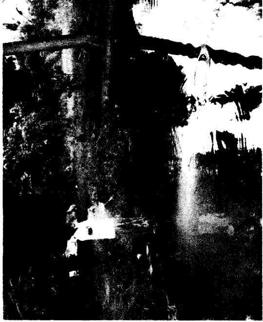
ការផ្តល់ចំណីត្រីក្រៅពីប្លង់តុងដែលមាននៅក្នុងស្រះត្រី

ក្រោយពីបានដាក់ត្រីចិញ្ចឹមក្នុងស្រះចំនួនមួយស្តាប់ យើងត្រូវតែបន្តការដាក់ដីមួយស្តាប់ម្តងៗ ដើម្បីរក្សាទឹកអោយមានពណ៌បៃតងរហូត ។ ដីដែលអ្នកត្រូវដាក់គឺតទៅតាមទំហំរបស់ស្រះ គឺស្រះ ១០០ ម៉ែត្រក្រឡា ត្រូវប្រើដីអ៊ុយរ៉េ ៤ ខាំ ដីដេអាប៊េ ១ ខាំ និងដីអាចម៍តោ ឬ ក្របីពី ២-៣ បង្កី ការដាក់ដីនេះអាចបន្ថែម ឬ បន្ថយវាទៅតាមភាពជាក់ស្តែង ដោយពិនិត្យទៅលើស្រះថ្មី ឬ ស្រះចាស់ និងពណ៌ទឹកក្នុងស្រះដែលមានស្រាប់ ។