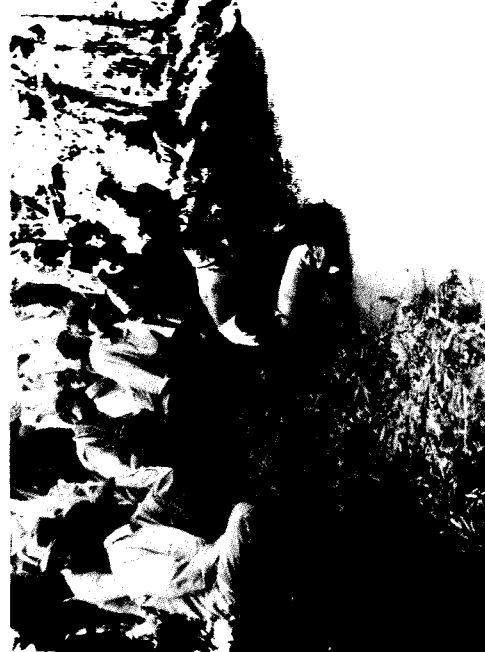
ការបង្ហាញពីរបៀបរំលងកូនត្រី ចូលទៅក្នុងស្រះចិញ្ចឹមត្រី