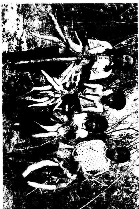
ការប្រមូលផលដោយដៃ

អ្នកត្រូវកាប់ដើមដំឡូងឈើចោលជាមុនសិន ដោយទុកដងដើមត្រឹមតែកំពស់ប្រមាណ២០-៥០ស.ម ការកាប់ដើមនោះ គឺងាយស្រួលក្នុងការដក ។ ពេលដកមើមអ្នកត្រូវរក្សាយ ឬ រង្អៀកដើមជាមុនសិន ទើបចាប់ផ្តើមដកបន្តិចម្តងៗ ធ្វើហ្នឹងនេះគឺដើម្បីជៀសវាងការបាក់មើម រហាត់សំបកមើម ។ វិធីម្យ៉ាងទៀតត្រូវកាប់ដងដើម មួយផ្នែកចោល ហើយបន្ទាប់មកត្រូវទុកចោលពី ៧ - ១៤ ថ្ងៃ សិន ទើបចាប់ផ្តើមដក ។