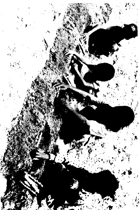
ការបង្ហាញពីរបៀបដាំផ្នែក

ការដាំរបៀបនេះអ្នកត្រូវដាក់ដើមដំឡូងបណ្តូងនៅក្នុងជួរតែម្តង ឬ ចាត់រងតែម្តងរួចអ្នកត្រូវកប់ដីពីលើដែលមានកំរាស់ ពី ៥-១០ ស.ម។