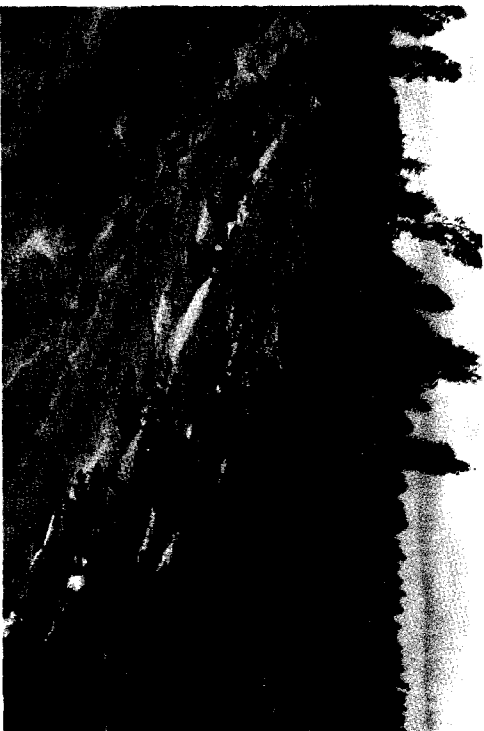
ចន្លោះព្រំដីកុម្មុយនិស្តមួយ ១ ម៉ែត្រ

ប៉ុន្តែជាទូទៅគេច្រើនដាំដំឡូងឈើ ក្នុងចន្លោះព្រំដីកុម្មុយនិស្ត កុម្មុយនិស្តមួយប្រវែងមួយម៉ែត្រ ហើយចន្លោះព្រំដីកុម្មុយនិស្តមួយគីឡូម៉ែត្រ មួយម៉ែត្រដែរ ។