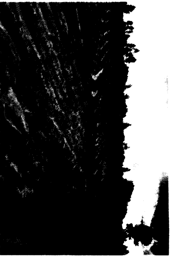
ការរៀបចំហាលដី