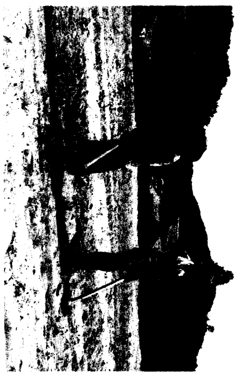
ការសំអាតស្មៅ

- បន្ទាប់ពីដំឡូងមានអាយុ ៣០ ថ្ងៃ ត្រូវជ្រួយដី ពោចស្មៅ អោយ បានស្អាតល្អដើម្បីឱ្យដីផុសក្រសុសល្អ ។