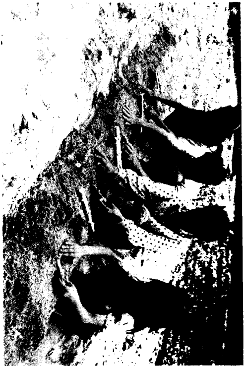
ការបង្ហាញពីរបៀបដាំបញ្ចៀង