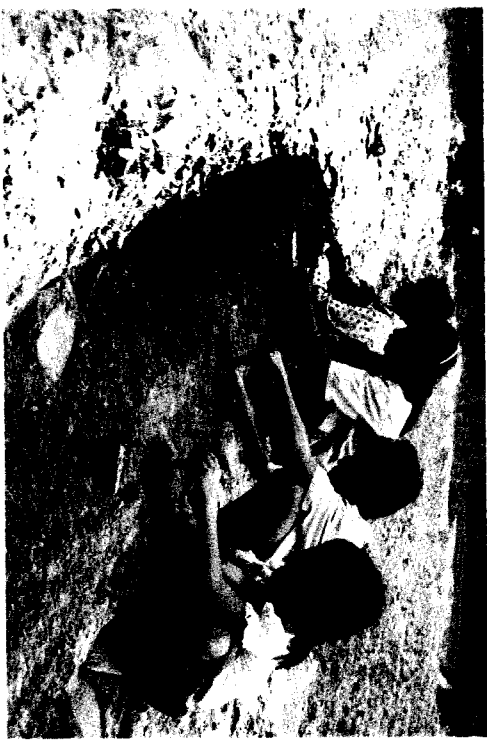
ការបង្ហាញពីរបៀបដាំបណ្តូង

ចំពោះវិធីសាស្ត្រទាំងបីខាងលើនេះ ជាទូទៅគេច្រើននិយម ដាំតាមរបៀបបញ្ចៀង ឬ ផ្នែកហើយ ពីព្រោះវាផ្តល់ទិន្នផលខ្ពស់ ។