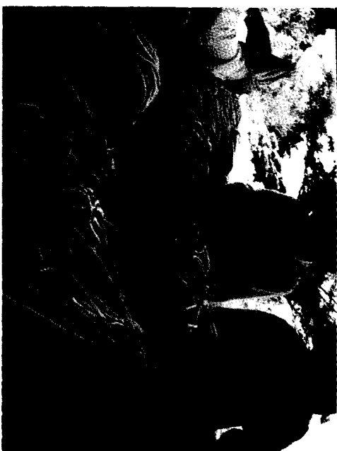
ផលិតផលត្រូវបានយកមកលក់

យើងត្រូវជ្រើសរើសផ្លែធំ កូរវែង រួចទុកផ្លែនោះអោយទុំស្អុត ហើយយកទៅហាលអោយបាន ២-៣ ថ្ងៃ រួចច្រកស្បោងក្រណាត់ទុកកន្លែងដែលមានខ្យល់ចេញចូល ។