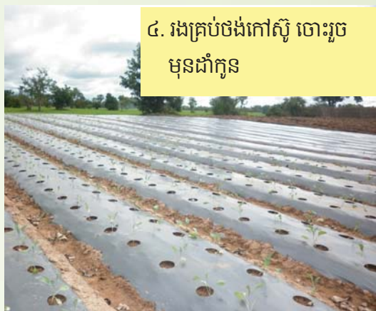
៤. រងគ្រប់ថង់កៅស៊ូ ចោះរួចមុនដាំកូន