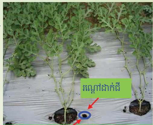
ប្រើលើ ឬ ឬស្សី ចោះរណ្តៅដាក់ដីបំប៉ន

ការដាក់ដីបំប៉ន: កប់ដីក្នុងរន្ធ ចោះសងខាងរណ្តៅ (ចំងាយ ពីគល់ ពី ៨ ទៅ ២៥ សង់ទីម៉ែត្រ ទៅតាមអាយុដំណាំ)។