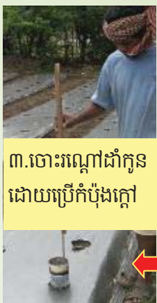
៣.ចោះរណ្តៅដាំកូនដោយប្រើកំប៉ុងក្តៅ