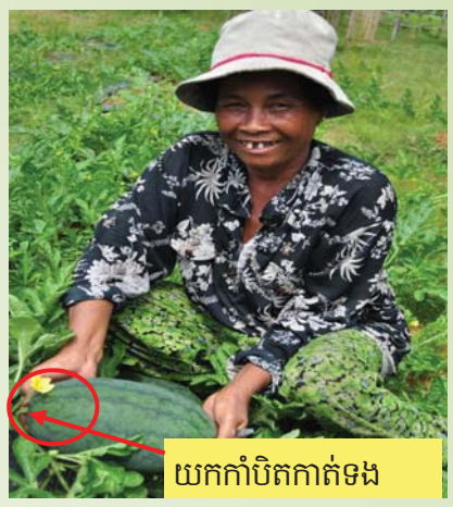
យកកាំបិតកាត់ទង