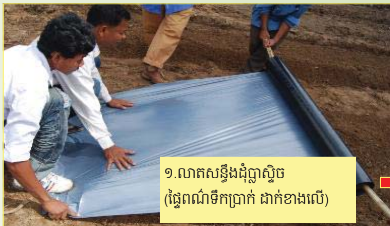
១.លាតសន្ធឹងដុំប្លាស្ទិក (ផ្ទៃពណ៌ទឹកប្រាក់ ដាក់ខាងលើ)