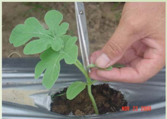
ដើមមេកាត់(ក្រៀវ)ត្រួយ នៅស្លឹក(ថ្នាំង)ទី ៥

ការកាត់ខ្នងឪឡឹក ត្រូវធ្វើនៅពេលវាមានស្លឹក (ថ្នាំង) ទី៥ ។ នៅពេលនោះ យើងត្រូវកាត់ត្រួយនៅស្លឹកទី ៦ ហើយវានឹងចេញខ្នង ៥ ពីស្លឹកថ្នាំងដែលទុក។ ក្នុងចំណោម ត្រួយខ្នងទាំង ៥ យើងត្រូវទុកតែត្រួយចំនួន ២ ទៅ ៣ (គឺ ត្រួយណា ដែលលូតលាស់ល្អ) ។ ត្រូវរាប់ពីស្លឹកចេញពីដើមមេទៅ ចំនួន ១២ ស្លឹក (ថ្នាំងដើមខ្នង) ត្រូវបេះផ្កាញី ចោលទាំងអស់។ ដូចនេះផ្កានិង ក្តីបត្រូវសំឡឹងមើល និង ទុកចាប់ពីស្លឹក/ថ្នាំង ទី ១៣ ឡើងទៅ ។ គេត្រូវជ្រើសរើសក្តីបដែលល្អជាងគេ ក្នុងខ្នងនីមួយៗ ហើយទុកតែក្តីបមួយនោះ ឱ្យទៅជាផ្លែធំ។