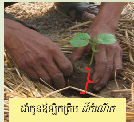
ដាំកូនឱឡើងត្រឹម ដីកំណើត