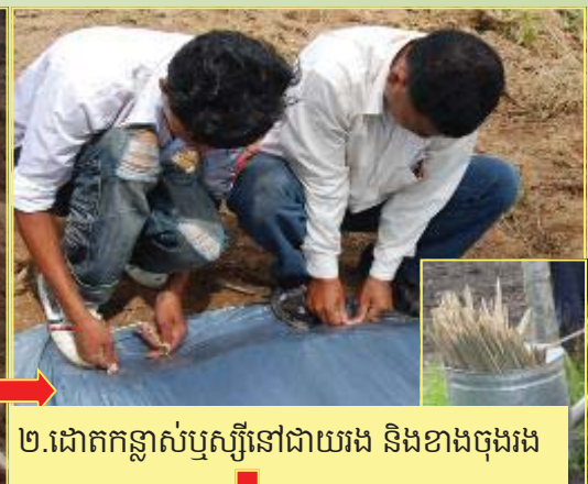
២.ដោតកន្ត្រាស់ឬស្បីនៅជាយរង និងខាងចុងរង